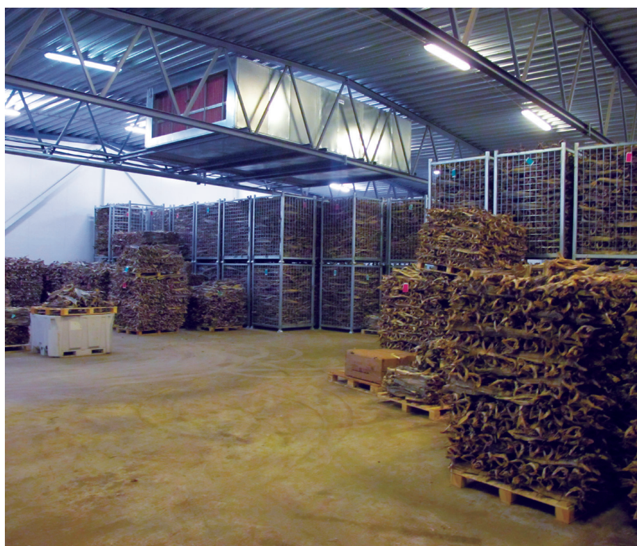
Pilotanlegget for klimastyrt lagring av tørrfisk som er etablert på Værøy.

Målet for dette prosjektet har derfor vært å utvikle og sikre nye lagringsformer slik at tørrfiskbransjen kan gå over til lagring i mer kontrollerte former. Dette vil sikre jevn, god og forutsigbar kvalitet på tørrfisken, i tillegg til å redusere vekttap under lagring. På denne måten kan næringen oppnå bedre kvalitet og en bedre pris for produktet, samtidig som skader og tap på grunn av uheldig lagring minimeres. Dette kan gi et mer forutsigbart produkt og gir bedre kontroll på kvaliteten. Dette gjør at en takler bedre forskjeller i råstoffet og tilpasser produktet lettere til ulike markeder.